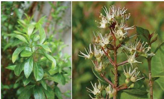
شکل (۲): گیاه حنا

مصارف عمده جهانی داشته و همچنین به عنوان برطرف کننده ترک خوردگی های پوست و نیز نرم کننده و ضد قارچ مصرف سنتی داشته است (۱۶). درختچه حنا، شاخه های غالباً خاردار و پوشیده شده از پوست خاکستری مایل به سفید دارد. ارتفاع آن حداکثر به ۶ تا ۷ متر می رسد. برگ های آن متقابل، ساده، کامل، به طول ۲ تا ۳ سانتیمتر، به عرض یک سانتیمتر، بیضوی و نوک تیز است (شکل شماره ۲). قسمت مورد استفاده حنا برگ آن است که به حالت کامل و یا به صورت گرد در معرض استفاده قرار می گیرد. پرورش حنا با آنکه در منطقه وسیعی از آفریقا می روید معهدا به علت مصارفی که دارد در بعضی نواحی معمول است (۱۷).