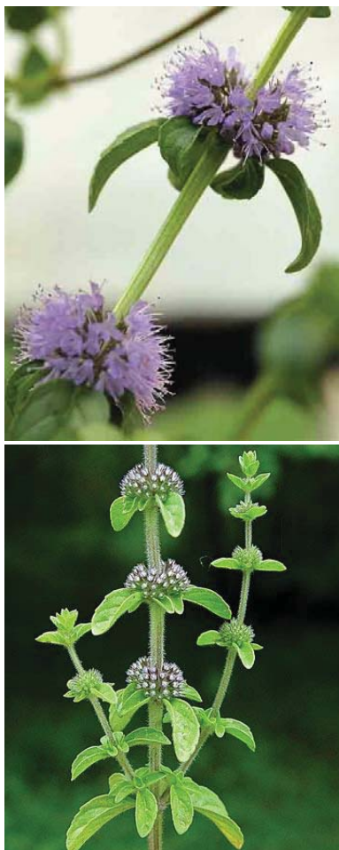
شکل (۱): گل های گیاه پونه

ترکیبات شیمیایی پونه: اعضای مختلف این گیاه دارای تانن، مواد رزینی، مواد پکتیکی، قند و اسانس است. این اسانس که مقدار آن بر حسب واریته های مختلف گیاه و مشخصات محل رویش، از ۰/۴ تا یک درصد تغییر می کند، دارای ۷۵ تا ۹۰ درصد از ترکیبات ستن دار مخصوصاً پوله ژون pule geone ، الکل های توتال (مانتول آزاد و استات دومانتیل) به مقدار ۷ تا ۱۲ درصد، لیمونن و دیپانتن است. اسانس مذکور به اسانس پونه یا Essence de Pouliot و یا Pennyroyal oil موسوم است و گاهی نیز با درخشندگی آبی رنگ جلوه می کند که علت آن وجود ماده ای به نام آزولن azulene در آن است. این اسانس در غالب روغن ها حل می شود ولی در گلیسرین غیرمحلول است. در برگ پونه وجود هسپریدین hesperidine یا دیوسمین diosmine مشخص