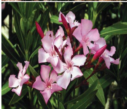
شکل (۵): گیاه خرزهره

جدول شماره ۱: گیاهان دارویی مورد استفاده در دفع حشره موریانه