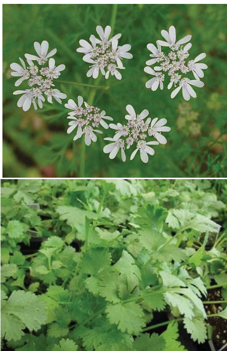
شکل (۴): گل و برگ های گیاه گشنیز. luirig.altervista.orgwww .

ترکیبات شیمیایی گشنیز: دانه گشنیز دارای ۷% آب، ۱۲ تا ۱۳ درصد اسیدهای چرب (شامل اسید اولئیک، اسید لینولئیک، اسید پتروسه لینیک)، ۱۸-۱۶ درصد مواد پروتئینیک، ۳۸% سلولز، ۱۳% مواد غیر از ته و ۱ تا ۱۸ درصد اسانس است. به علاوه مانیول و گلیکوزیدهای فلاونوئیدی نیز در میوه موجودند. گلیکوزیدهای فلاونوئیدی موجود در دانه گشنیز عبارتند از: روتین، کوئرستین، ایزوکوئرستین. همچنین تانن و کومارین، موسیلاژ و اسیدهای فنلی و اسید کافئیک در دانه آن وجود دارد. اسانس گشنیز دارای ۷۰-۹۰ درصد لینالول راست گگرد (d-linalol) یا کوریاندرول (coriandrol) ۲۰% هیدروکربن‌های منو ترپینی شامل \gamma و \alpha ترپین، \beta و \alpha فلاندرین، p-سیمن، (-) بورنتول و کامفرو نیز به مقادیر بسیار جزئی آلدئیدسیلیک و اترهای لینالیتیک می‌باشد (۲۹). اسانس گشنیز، از میوه کامل گیاه بر اثر تقطیر با بخار آب حاصل می‌شود و دارای ۷۰ تا ۹۰ درصد لینالول راست (d-linalool) یا کوریاندرول (coriandrol)، ۵ درصد پننن راست، لیمونن،